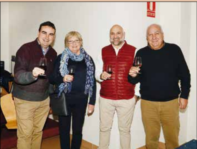
Brindis de la familia Jiménez