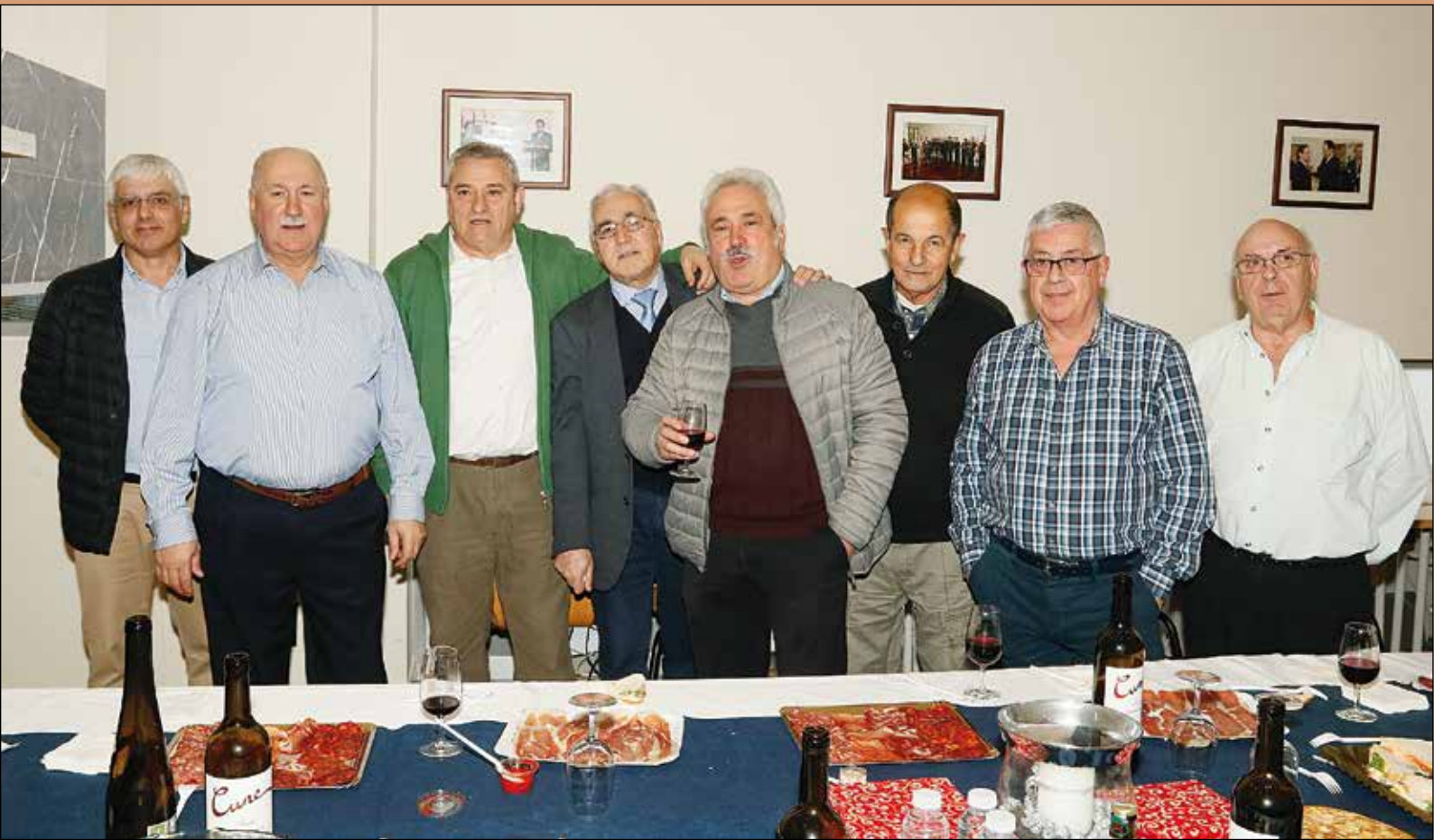
Colegiados y asistentes disfrutando del Vino Español