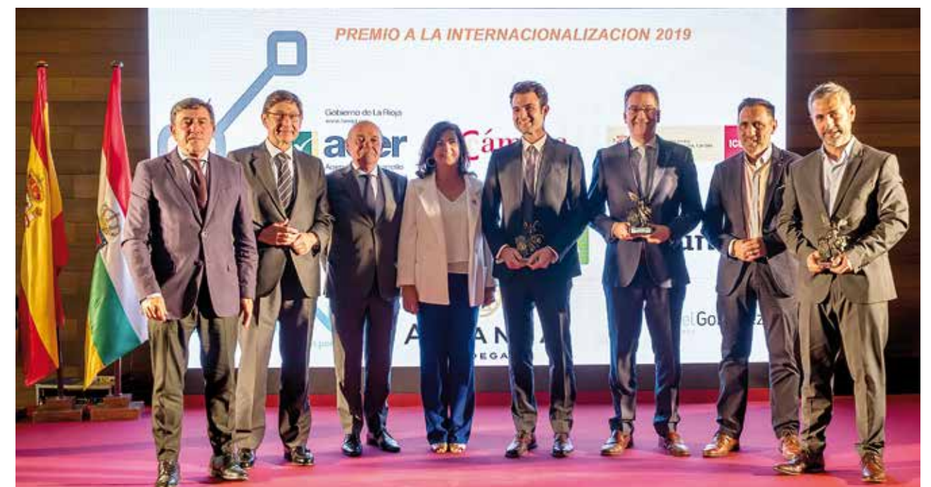
Autoridades y representantes de las empresas galardonadas

En la presente edición, el Jurado instituido por los miembros de la Comisión de Internacionalización de la Cámara de Comercio, ADER e ICEX acordó conceder este galardón, como reconocimiento a su destacada labor de promoción y desarrollo de la exportación riojana a: Bodegas Altanza / Teinnova / Rafael González Business Group.