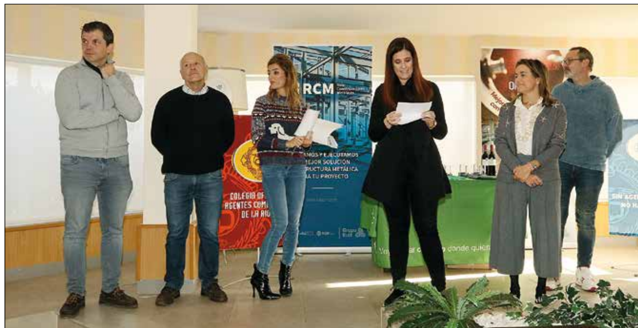
Miembros de la organización presentando el acto junto a autoridades y patrocinadores