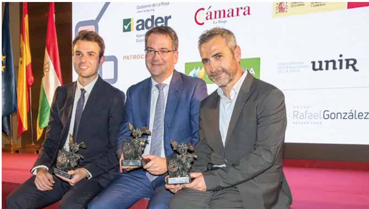
Empresas galardonadas con los Premios a la Internacionalización de La Rioja