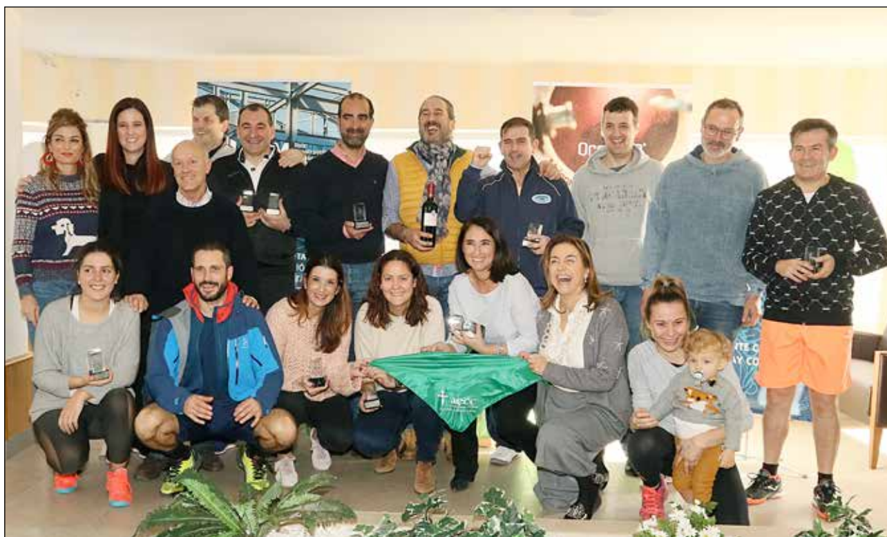
Participantes en el VII Torneo de Pádel